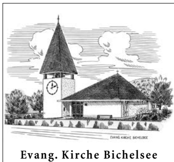
Evang. Kirche Bichelsee

FÜR DIE EVANGELISCHE LANDESKIRCHE DES KANTONS THURGAU | 131. JAHRGANG | NR. 4 | APRIL 2024